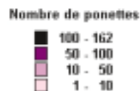
Carte des poulinières* par région en 2002 selon leur lieu de stationnement

La Bretagne, la Normandie, le Centre et l'Auvergne concentrent les effectifs les plus importants ; ces régions sont suivies par le Centre-Ouest, le Nord-Picardie, la Lorraine et l'extrême Sud-Est. Le Sud-Ouest, Rhône-Alpes, Franche-Comté et Champagne-Ardennes possèdent les effectifs les plus faibles.